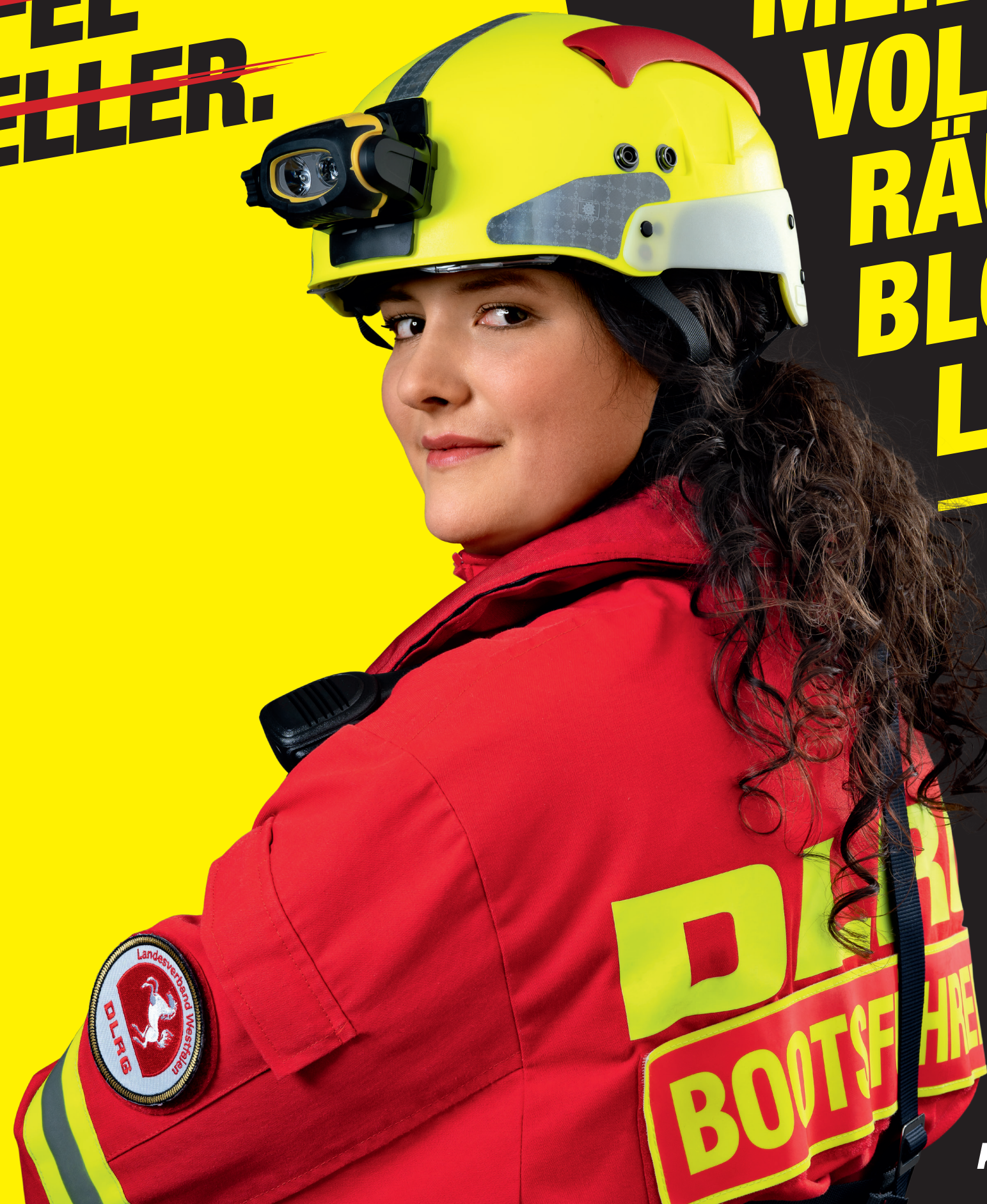
KIRA, DLRG DÜLMEN

MEIDEST DU VOLLLAUFENDE RÄUME! WASSER BLOCKIERT TÜREN. LEBENSGEFAHR!